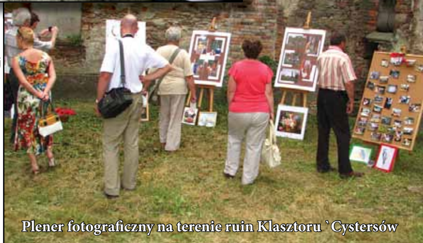
Plener fotograficzny na terenie ruin Klasztoru `Cystersów

Na terenie Wierzbnej znajduje się wiele cennych zabytków kultury materialnej oraz wspaniałe tereny zachowane w stanie naturalnym pozwalające na codzienne obcowanie z przyrodą.