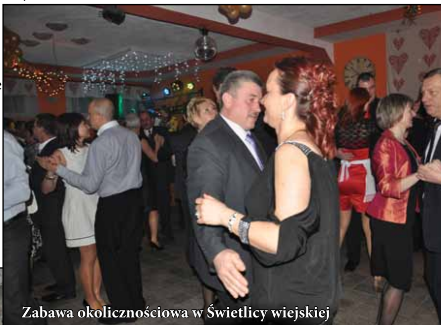
Zabawa okolicznościowa w Świetlicy wiejskiej

Dzięki aktywności mieszkańców, przez cały rok odbywa się wiele interesujących imprez środowiskowych i kulturalnych.