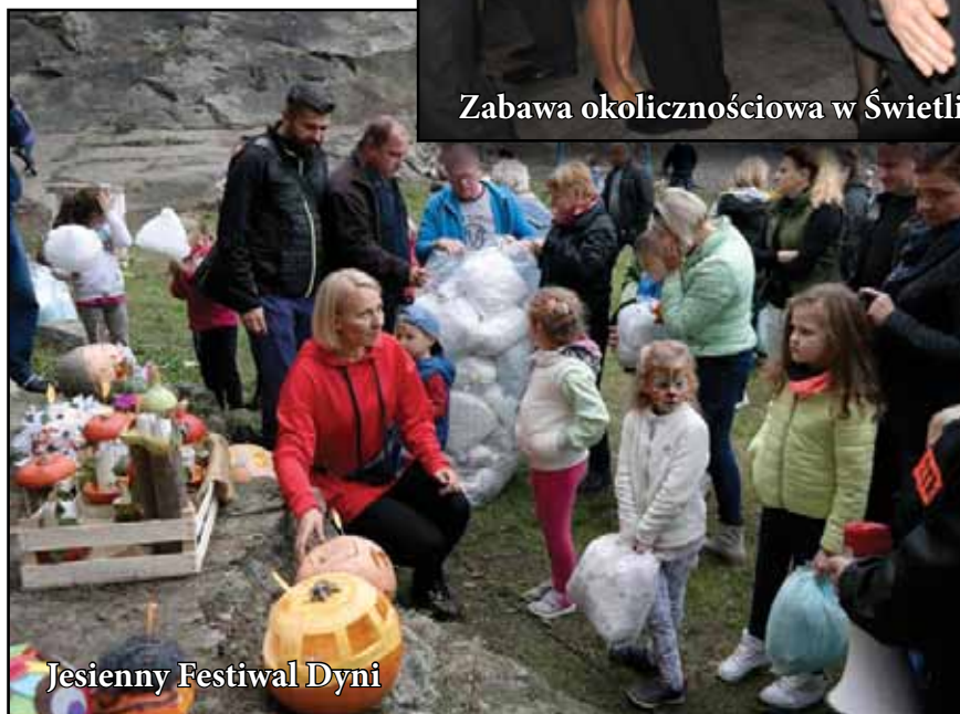
Jesienny Festiwal Dyni

Aktywnie działa Rada Sołecka, Koło Gospodyń Wiejskich, Ochotnicza Straż Pożarna, a mieszkańcy mają do dyspozycji nowoczesną Świetlicę Wiejską z dobrze wyposażonym zapleczem.